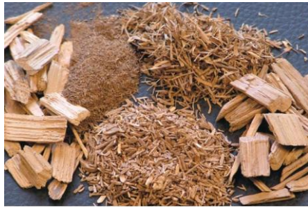
Trozos de Madera de Roble

The method of accelerated maturation involves the close relationship between wine, wood and oxygen, with its ensuing difficulties in terms of control. It responds basically to the sum of two processes: the maceration-infusion of chips and pieces of oak wood in the wine depot and micro-oxygenation, contribution to the wine of small amounts of oxygen, trying to reproduce the oxidation process of the wine in its oxidation. The combined use of these techniques, profiled by the different grades of roasted oak staves, optimizes the results of aging and maturation.